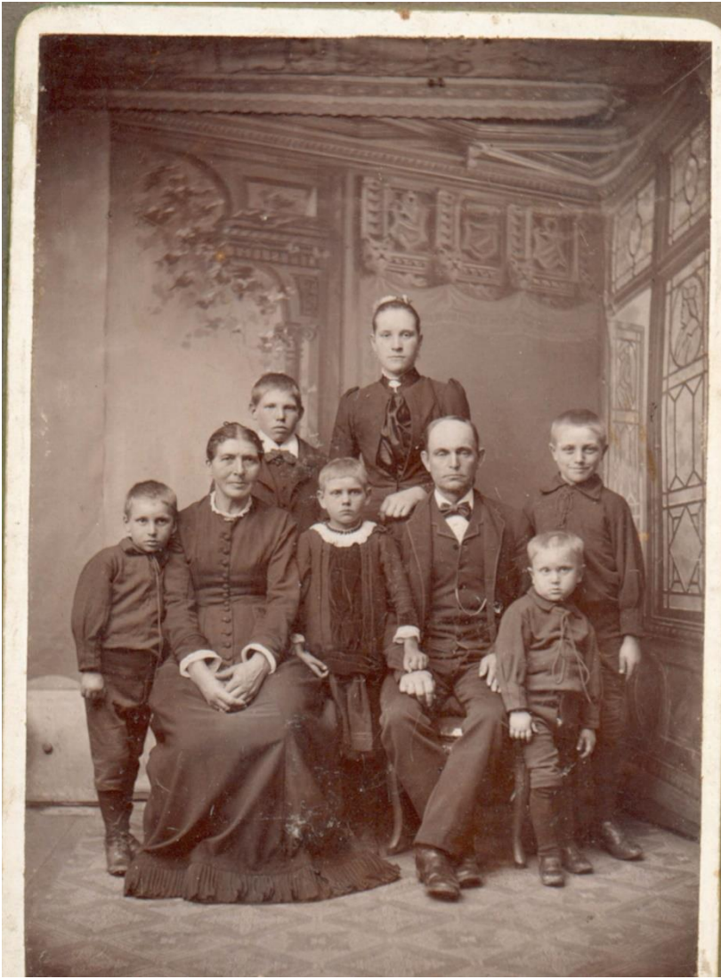
Familien ca. 1890.